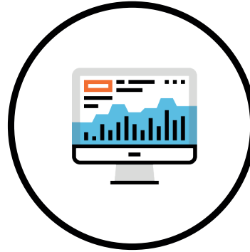
Sales & Purchase Cube

*Coresuite Country Package wird benötigt **Verwendung vom Booking Wizard wird empfohlen